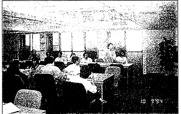
• 社會發展研修班上課情形(二)