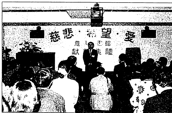
· 慈林圖書館獻館典禮