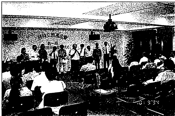
· 第一屆社會發展研修班結業典禮

我們是一群在台灣各個角落從事社會運動的工作者，基於追求自我成長的理念，以及肯定研修班創設的目標——充實社會改革運動工作者的知識學養、擴充其人生及世界視野、提昇其氣質及工作能力——不約而同的接受了三個月期間一二〇小時的課程學習，和九個月期間的組織工作實習。